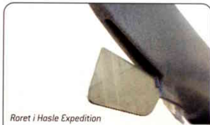
Roret i Hasle Expedition kan trekkes opp i en slisse i skroget. Opptrukket kan man faktisk slepe kajakken med det rustfrie rørbladet i bakken eller på steingrunn.