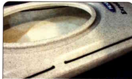
Festesnorene på dekk er trukket gjennom integrerte støpte føringer i skroget for å unngå påskrudd knaster.

Hasle Expedition er av god konstruksjon og et godt alternativ for den litt øvede som vil ha en trygg og solid PE-kajakk med mange gode praktiske løsninger.