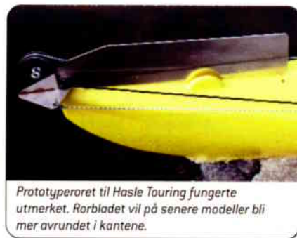
Prototypororet til Hasle Touring fungerte utmerket. Rorbladet vil på senere modeller bli mer avrundet i kantene.