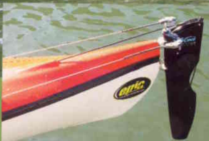
Epic Touring's «hi-tech» ror.