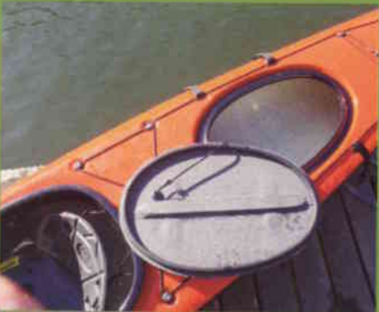
Letthåndterlige lukeløkk i Epic Touring, som også holder tett.