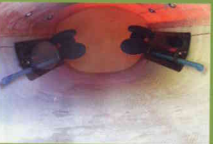
Smarte hendler for kombinert justering av fotstøtte og ror. En tilsvarende hendel på styrbord side i cockpiten justerer wirelengden.

Touring'ens lange vannlinjelengde gjør at det er lett å holde høy cruising fart.