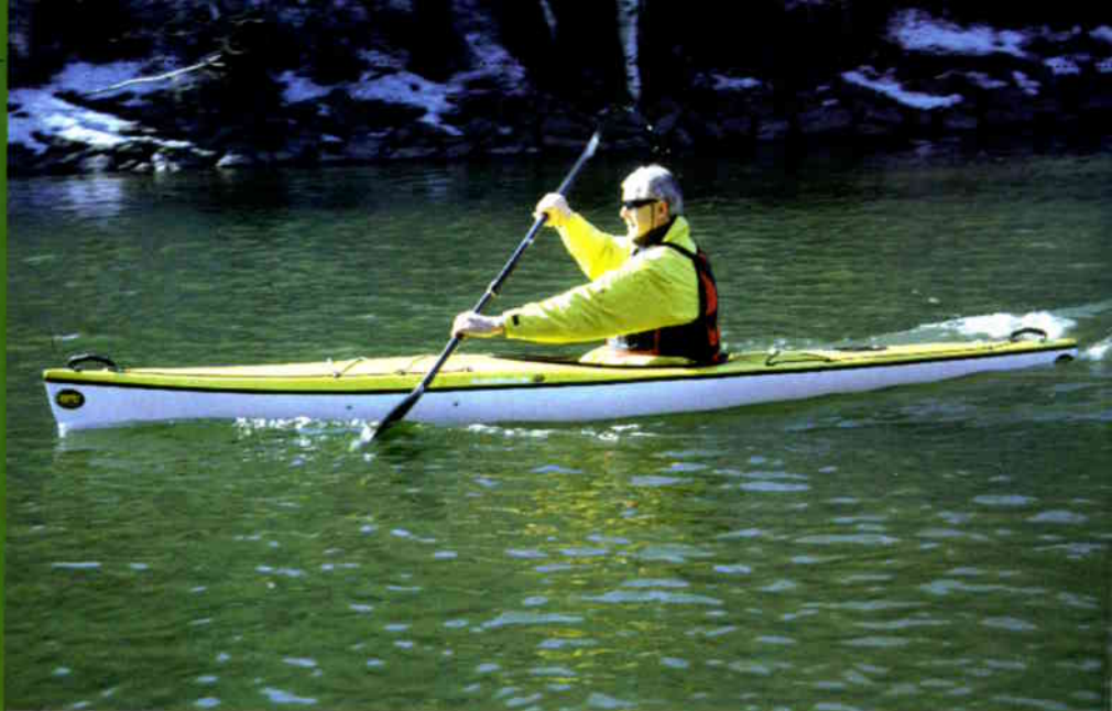
Epic Recreational GP er lett å få opp i fart og glir godt takket være et godt bølgemønster.