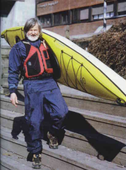
Med en vekt på bare 15 kg er Recreational'en lett å frakte med seg.