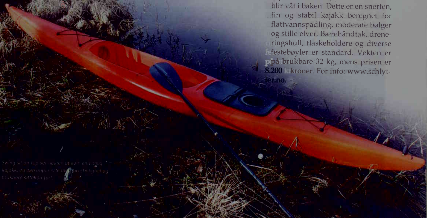
Swing sit-on-top ser nesten ut som en vanlig kajakk, og den imponerte med sin stødighet og brukbare sittekomfort.

Oceankayak Aegean kan padles av en eller to personer. Den kan utstyres med gode seter som holder såpass stor sitte høyde at man ikke blir våt i baken. Dette er en snerten, fin og stabil kajakk beregnet for flattvannspadling, moderate bølger og stille elver. Bærehåndtak, dreneringshull, flaskeholdere og diverse festebøyler er standard. Vekten er på brukbare 32 kg, mens prisen er 8.200 kroner. For info: www.schlytter.no .