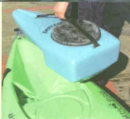
Smart avtagbart lasterom som kan bæres på land