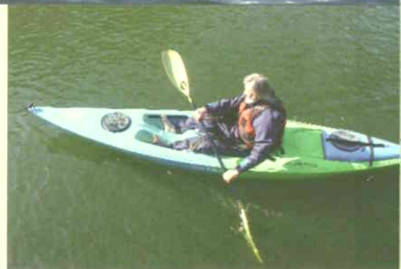
Man sitter som stopt i Freedom en