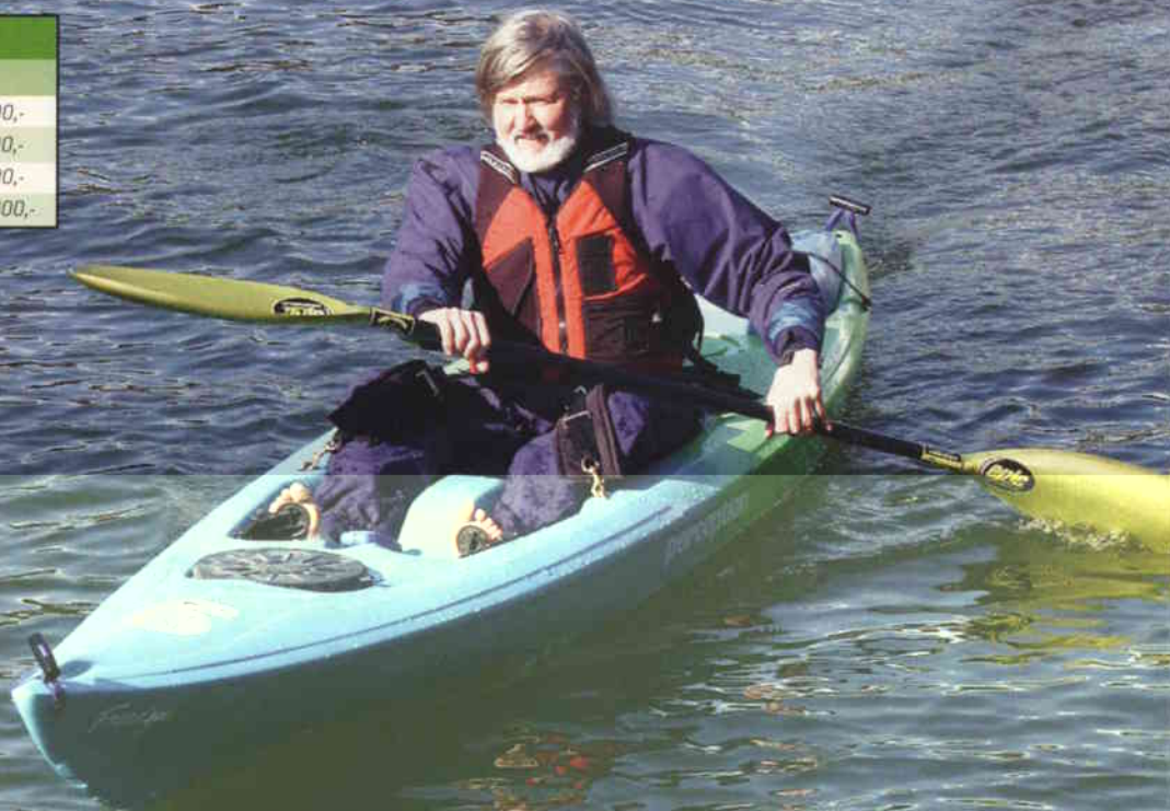
Perception Freedom Surf overrasket positivt som en trygg, stabil og lettpadlet sit-on-top kajakk.