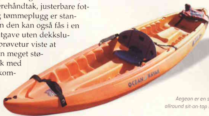
Aegean er en snerten allround sit-on-top kajakk.