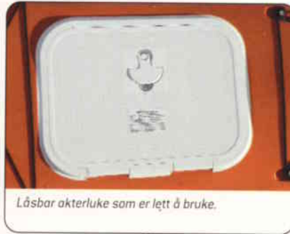
Låsbar akterluke som er lett å bruke.