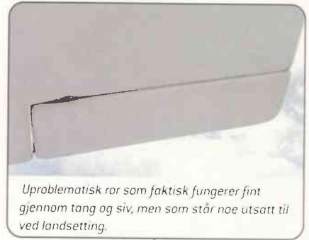
Uproblematisk ror som faktisk fungerer fint gjennom tang og siv, men som står noe utsatt til ved landsetting.