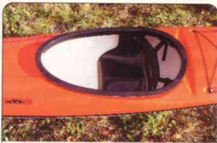
Setearrangementet er en integrert del av cockpitkarmen/ringen.