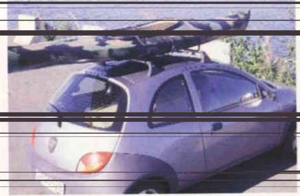
Lett å stue på taket på selv små biler.

knop eller mer kverer mye bruk av krefter.