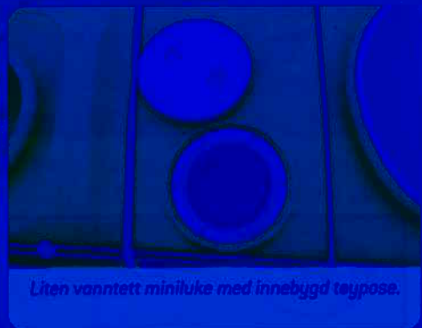
Liten vanntett miniluke med innebygd teypose.