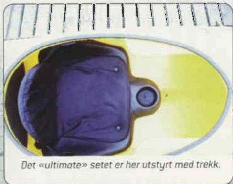
Det «ultimate» setet er her utstyrt med trekk.