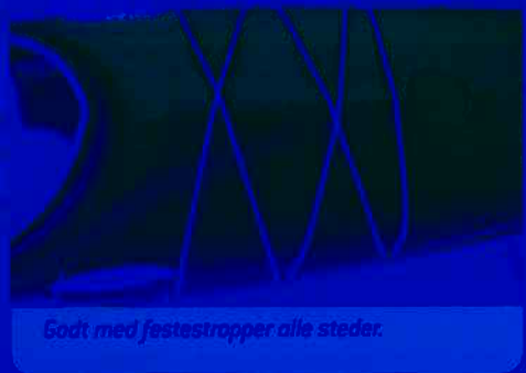
Godt med festestropper alle steder.