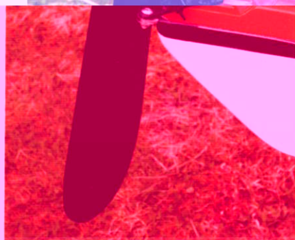
NorthSea har et effektivt roret som kan vippe opp på dekket.

Ønsker du deg en komfortabel, lettpadlet og litt utfordrende havkajakk som ikke stikker av med alle feriepengene, bør du ta denne med i vurderingen før du bestemmer deg. Forholdet mellom pris og kvalitet er helt fenomenal. Mange som padler lar seg skremme av at enkelte kajakker er temmelig kostbare. Selv om prisnivået av og til kan forsvares, hjelper det lite hvis man ikke er villig til å spandere alle disse kronene på en båt. Den testede kajakkten krever litt balanse, men er uvanlig sjødyktig. Lav vekt kan selvsagt føres på bonuskontoen.