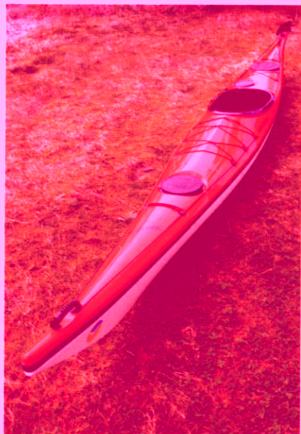
Forskipet på NorthSea tar bølgen mykt og elegant. Dekket har veldig høy finish.